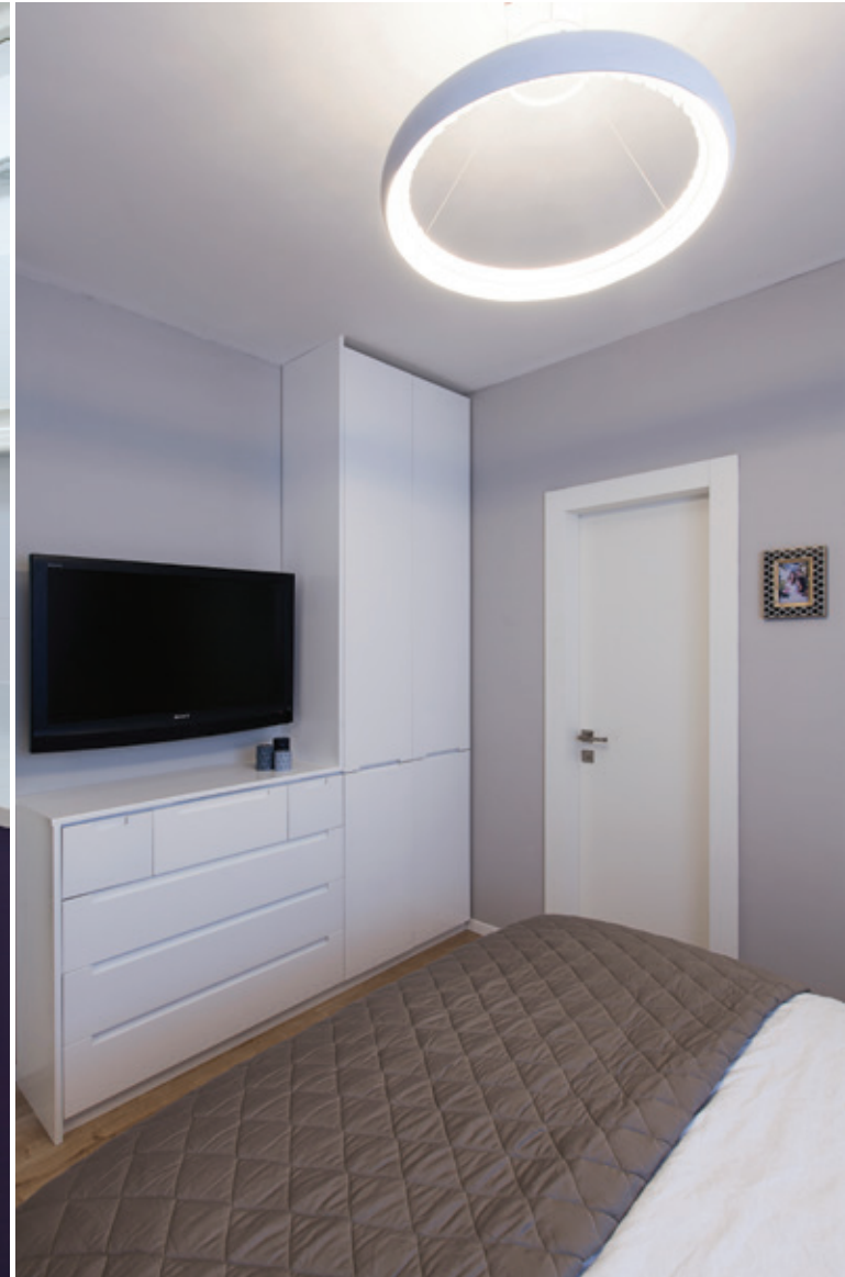
חדר שינה: "רוזטו"