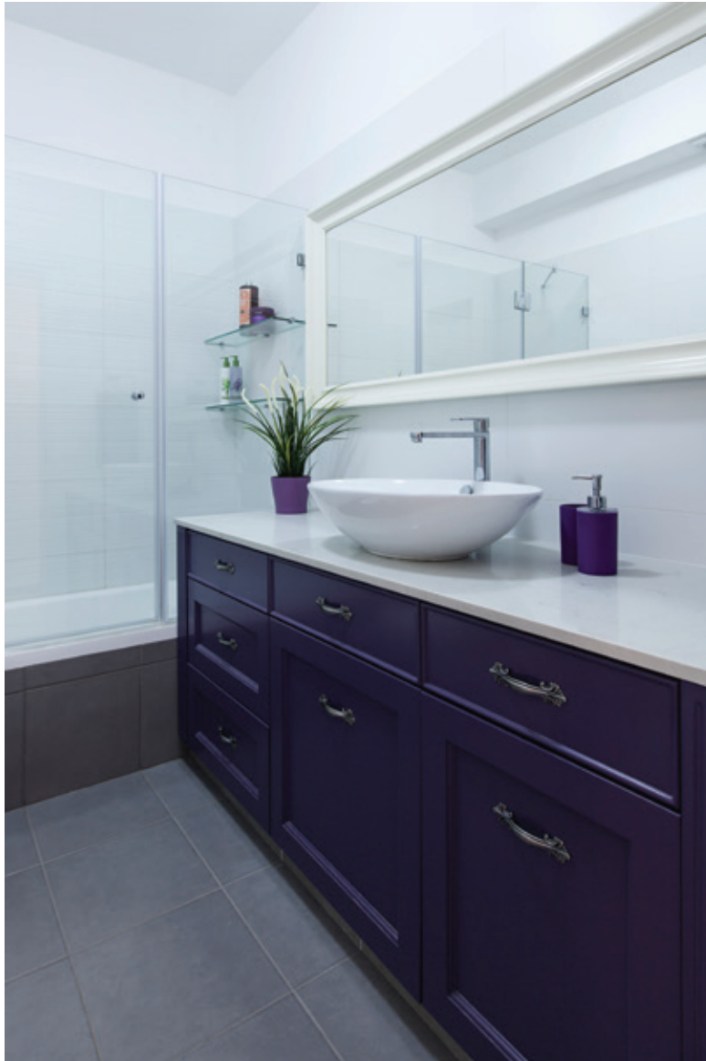
חיפוי, ריצוף וכלים סניטריים: "נגב"