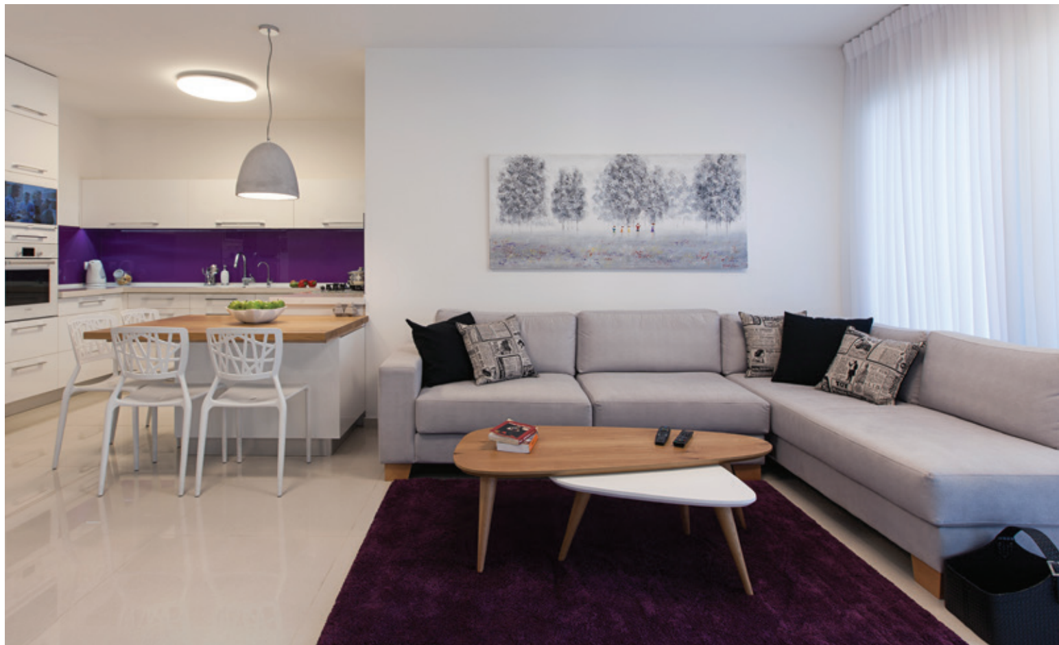
מטבח: "אביבי", שטיח: "איקאה", ציורים: אפרת אילן

מאת דב יהלומי / עיצוב פנים יעל שביט